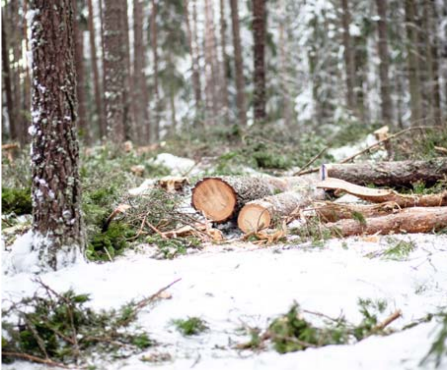
Parhaan metsätuoton saavuttaakseen metsää pitää hakata ja hoitaa. Harvennukset nopeuttavat puuston järeytymistä ja lisäävät ainespuun tuotosta.