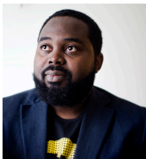
Jallow: Hudfärg, etnicitet, rasism, afrofobi.