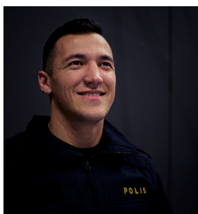
Valon: Antireligiöst motiv, islamofobiskt.