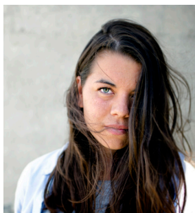
Elsa: Sexuell läggning.

Samtliga motivkategorier finns representerade i berättelserna: