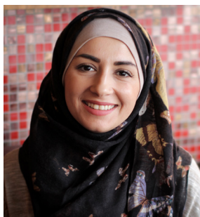
Hala: Antireligiöst motiv, islamofobiskt.