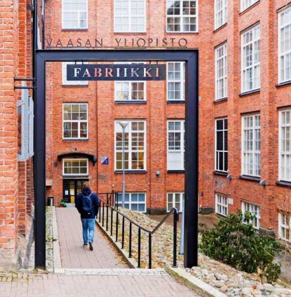
Yliopisto toimii historiallisissa puuvillatehtaan tiloissa.

koulut yhteen niputtava kaupunkikampus on nyt yli 7000 opiskelijan työmaa.