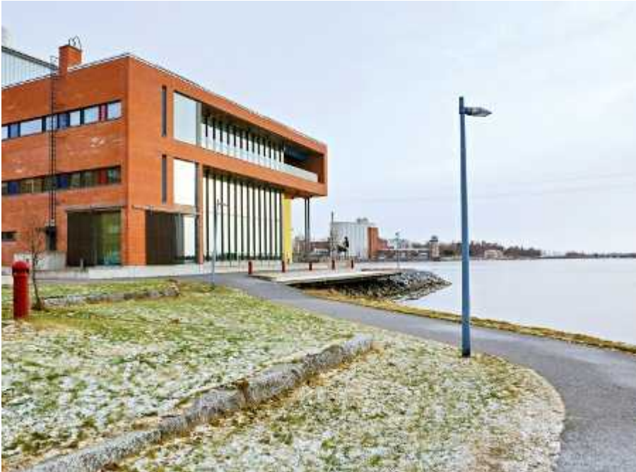
Merellinen Palosaaren kampus yhdistää Vaasan suomen- ja ruotsinkieliset ammattikorkeakoulut.