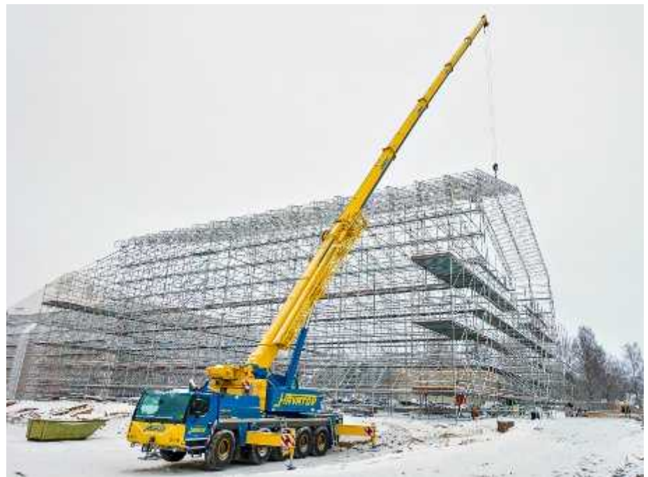
Tuupalan koulu Kuhmossa on vihreän rahoituksen kohde.

Tuupalan puukoulu on yksi ensimmäisistä kohteista, joille on myönnetty Kuntarahoituksen vihreää rahoitusta. Kuhmo on laajemminkin biotalouden edelläkävijöitä: uusiutuvan primäärienergian käyttöaste on kaupungissa lähes 70 prosenttia, mikä on maailmanlaajuisista huipputasoa.