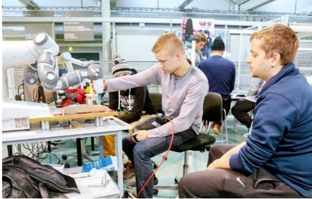
VAMK vauhdittaa robotiikan osaamista ja robottiteknologian käyttöönottoa alueen yrityksissä.

K aksikäätinen Yumi-robotti suorittaa vaativaa tehtävää. Se yrittää tiputtaa rautalan-gasta taivutetun pinnan puurimalle. Ei tempu eikä mikään ihmiselle, mutta koneelle kova haaste. Kun kone oppii liikkeen, se voi toistaa sitä loputtomiin – toisin kuin ihminen.