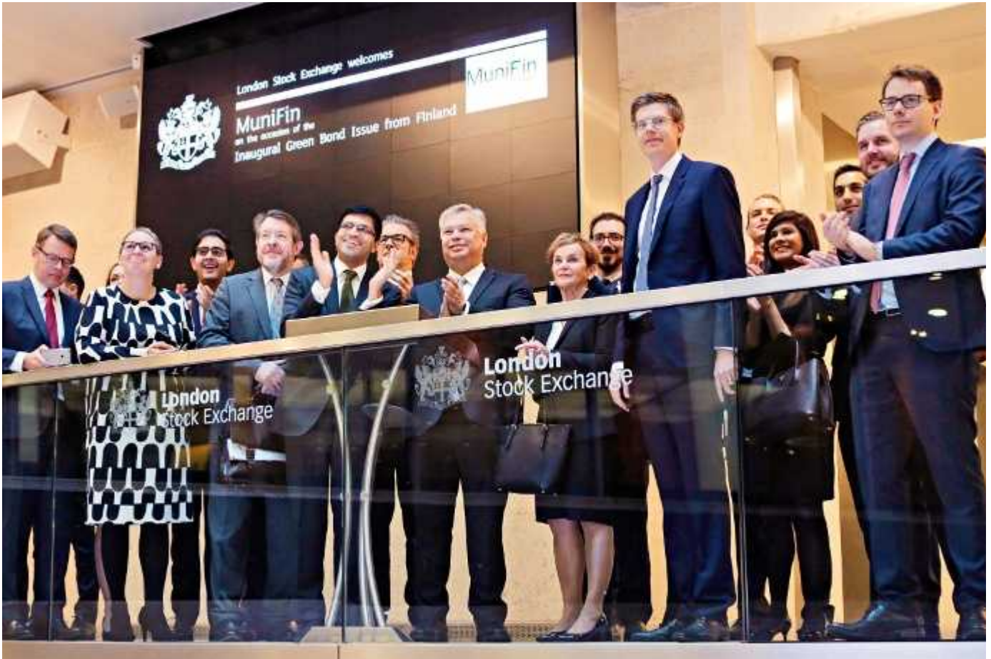
Vihreän bondin kunniaksi järjestetty kaupankäynnin avausseremonia avasi Lontoon pörssin kurssit noususuuntaisina.