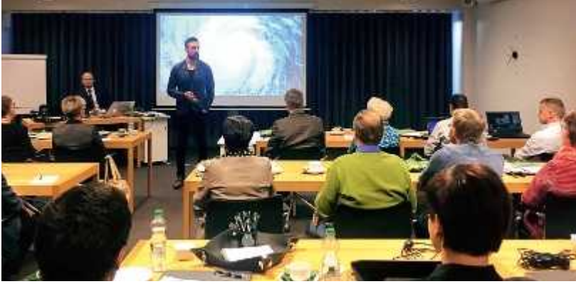
Apollo on Kuntarahoituksen asiakkaille tarjottu ratkaisu rahoitussalkun hallintaan.