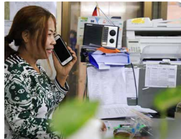
Rukous kuuntelijoiden puolesta on tärkeä osa kristillisten mediajärjestöjen yhteydenpitotyötä.