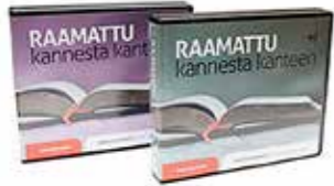
Jukka Norvanto Raamattu kannesta kanteen -ohjelman opetuksista cd-levyt MP3-muodossa: Uusi testamentti (624 luentoa) 130 €. Vanha testamentti (810 luentoa) 140 €. TARJOUS! Uusi ja Vanha testamentti yhdessä ostettuina 200 €.