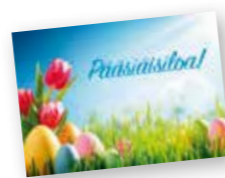
1-os pääsiäiskortit 0,50 € /kpl tai 10 kpl/2 € TARJOUS! Kannessa: Pääsiäisiloa! Takana: Kristus on ylösnoussut, uusi elämä on voittonut!

Lähetyskauppa Putiikin verkkosivuilla on runsas valikoima erilaisia kristillisiä kirjoja, kortteja ym. lahjatarvike. Kannattaa tutustua!