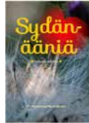
Mervi Viuhko (Toim.) Sydänääniä korona-aikana 10 € TARJOUS! Sisältää kertomuksia, muistelmia ja ajatelmia elämän sykkeestä, erityisesti medialähetyksestä. Kirjoittajina ovat Medialähetys Sanansaattajien työntekijät, seniorit ja työssä eri tavoin mukana olevat, arkipiispasta vapaaehtoisiin. Nelivärikuvitus ja kovakantinen. Julkaisijana Sansa.

Sisältää vähintään yhden hartauden jokaisesta Psalmien kirjan 150 luvusta.