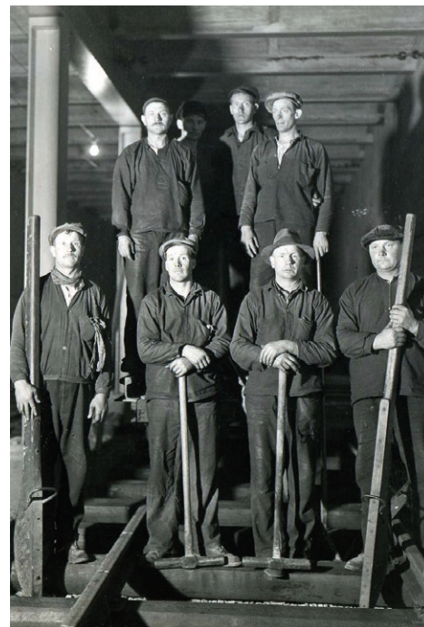
Katarinatunneln 29 juni 1933. Några av de 800 arbetarna i tunneln.

Nu beror ersättningen från a-kassan på vilken inkomst personen hade när hen arbetade. En skillnad är också att a-kassorna och fackförbunden i dag är olika organisationer. Du kan vara medlem i en a-kassa utan att vara med i facket och tvärtom.