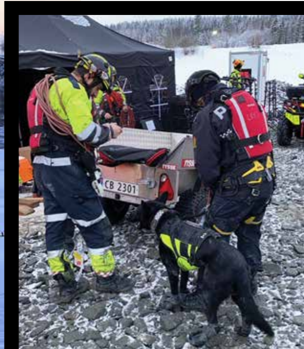
BRUK AV HUNDER til søk gjør jobben med å finne mennesker langt enklere.

Kontakt vår lokalavdeling på post@dooa.no eller hund@dooa.no