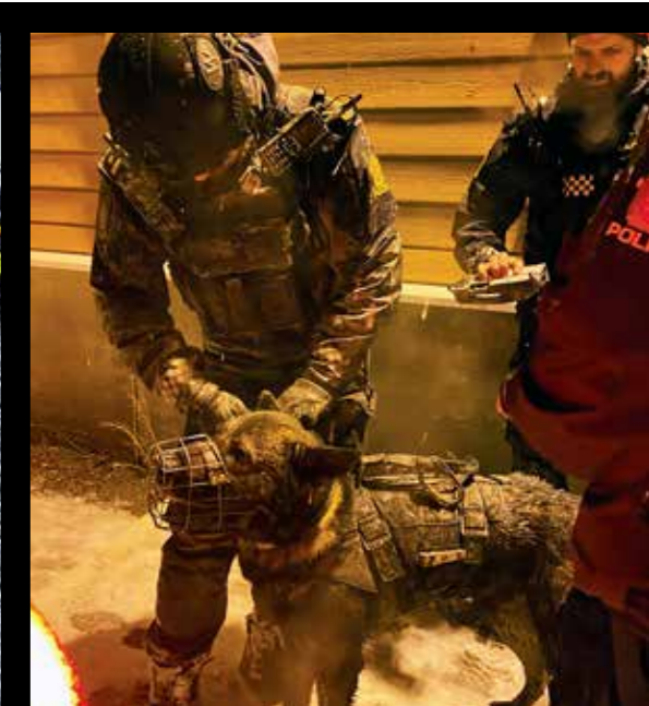
POLITHUNDENE har forsterket vest, potesokker og ofte munnkurv som beskyttelse under oppdrag. Likevel ble flere av hundene skadet under søkene, blant annet Piko, som ble sykemeldt et par uker.