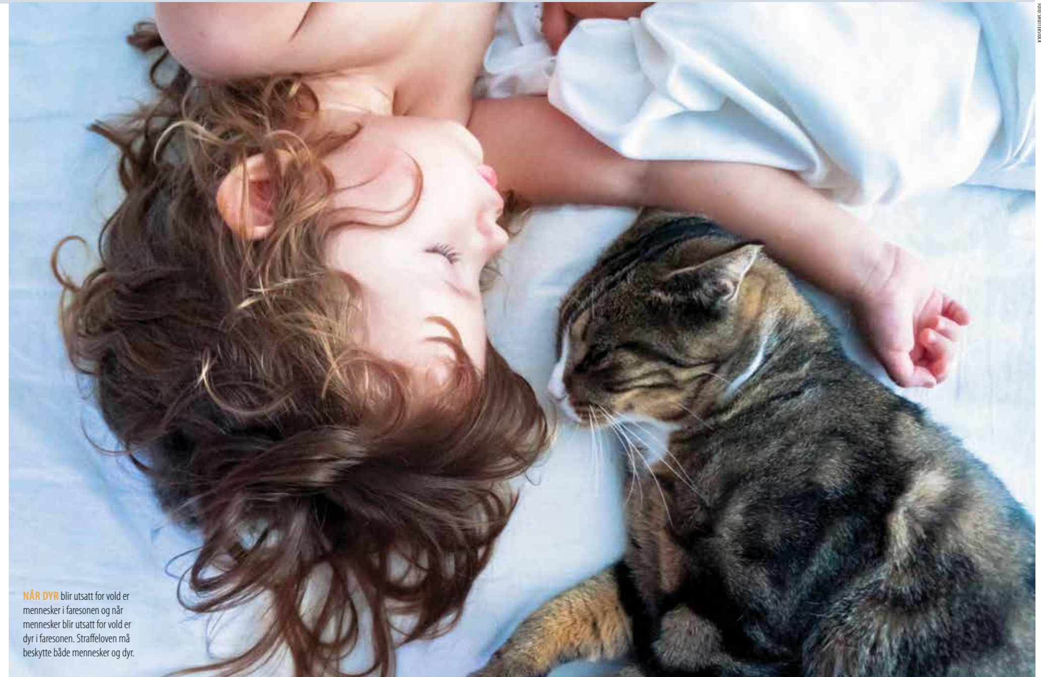
NÅR DYR blir utsatt for vold er mennesker i faresonen og når mennesker blir utsatt for vold er dyr i faresonen. Straffeloven må beskytte både mennesker og dyr.

Dyrebeskyttelsen Norge mener videre at det må være sterkt skjerpene når dyr for eksempel tortureres til døde for å straffe en annen person. Det finnes mange eksempler på at rettssystemet ikke klarer å fange opp slike alvorlige voldshendelser i form av tortur av dyr som et ledd i annen voldsproblematikk.