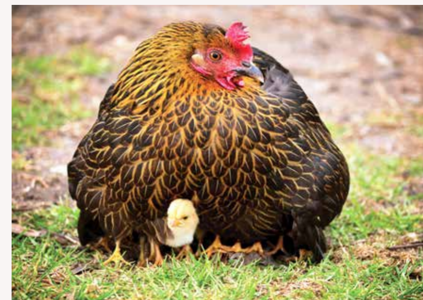
FJØRFE har som andre dyr en lovfestet egenverdi, men vi trenger et spesifikt forbud mot offerhandlinger for å gi dyrene bedre rettsvern.

Menneskers reaksjoner til hendelser som dette, påvirkes nok ofte av dyrearten. Det kan være lettere å overse dyrs lidelser når det kommer til dyrearter vi ofte har et mindre følelsesmessig forhold til. Det er allikevel viktig å minne om at disse hanene er beskyttet av loven på lik linje med dyr som hund, hest og sau. Kanskje vi ville reagert sterkere om det var fire hodeløse valper som var blitt funnet på gravplassen?