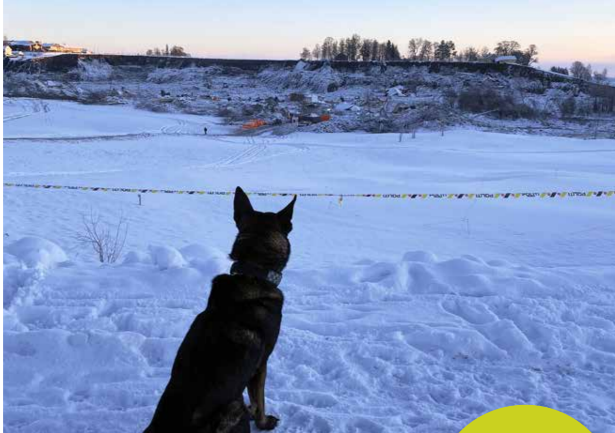
Politihunden Piko (7 år) ser ut over rasmrådet i Gjerdrum.