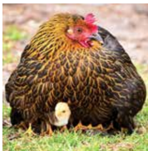
Flere fjørfe har blitt funnet halsugget på en gravplass.