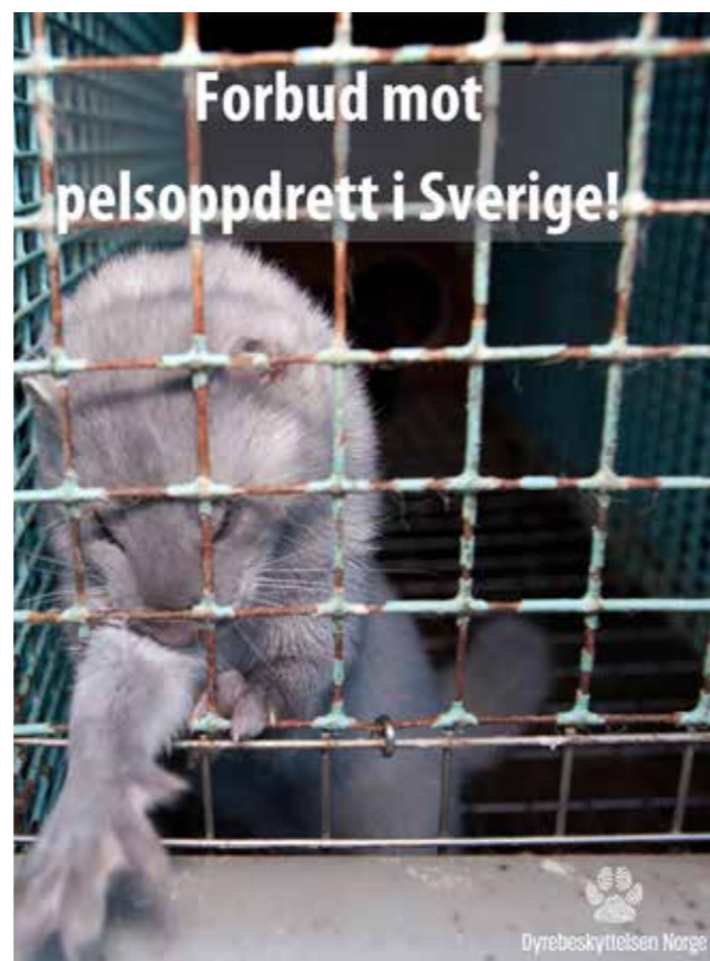
Forbudet mot oppdrett av mink skal vare ut 2021. Dette kan føre til en permanent nedstengning av pelsdyrnæringen i Sverige.

SOM FØLGE AV Covid-19, innfører Sverige nå et forbud mot avl av mink - i første omgang ut 2021 for å hindre spredning av mutert koronavirus. Fra før av har det vært forbud mot oppdrett av rev til pels i Sverige. Danmark har også midlertidig forbud mot oppdrett av mink, inntil koronapandemien er under kontroll.