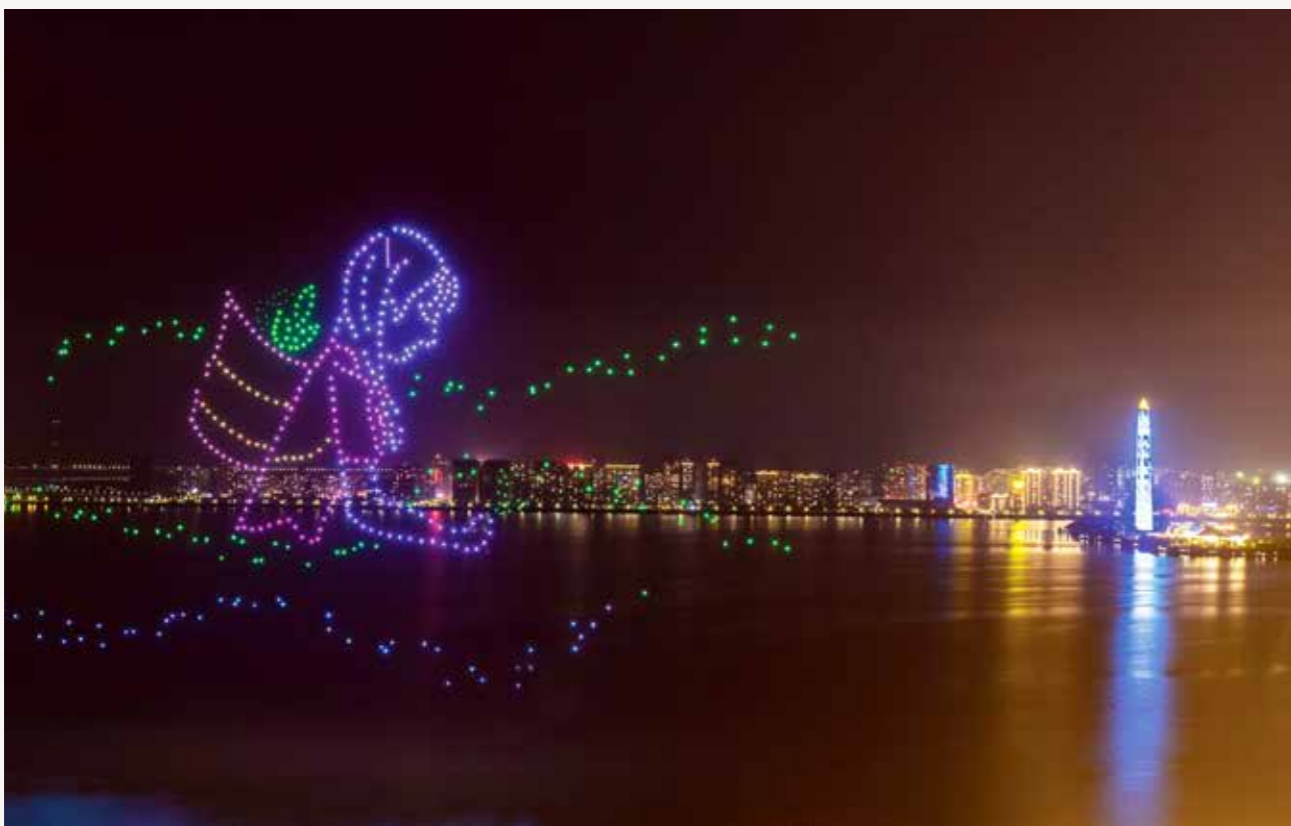
DRONEDISPLAY er et godt alternativ til fyrverkeri. Dronene forteller historien om tedyrking i et distrikt i Kina.