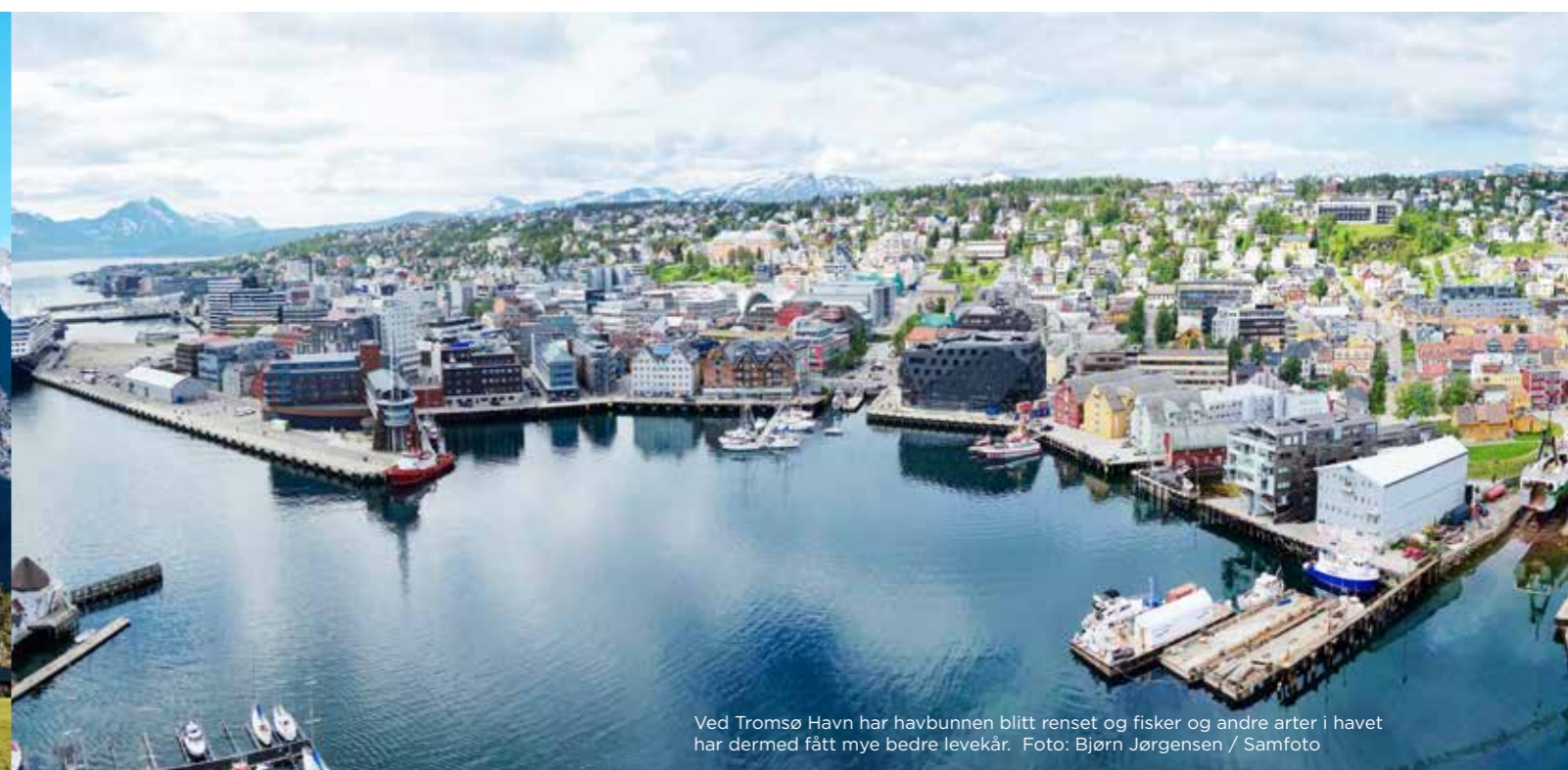
Ved Tromsø Havn har havbunnen blitt rensset og fisker og andre arter i havet har dermed fått mye bedre levekår.