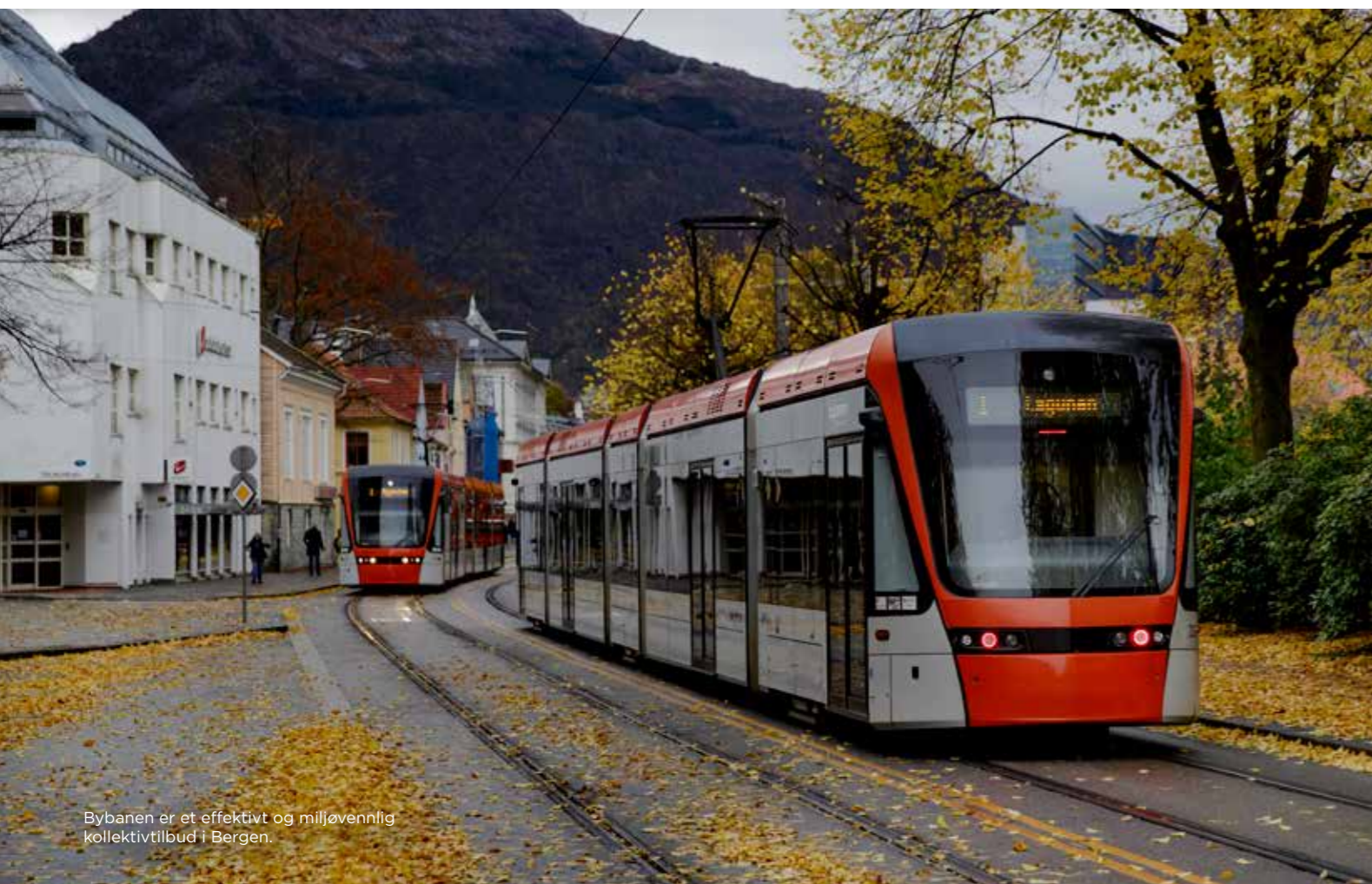
Bybanen er et effektivt og miljøvennlig kollektivtilbud i Bergen.