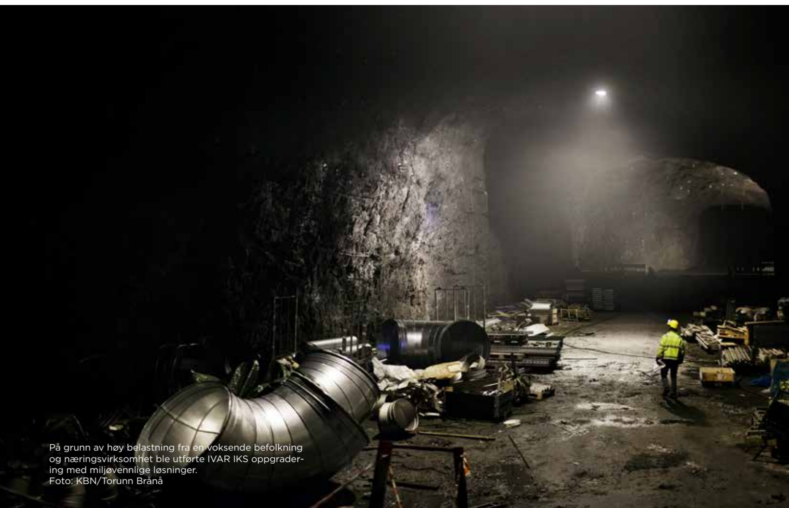
På grunn av høy belastning fra en voksende befolkning og næringsvirksomhet ble utførte IVAR IKS oppgradering med miljøvennlige løsninger.