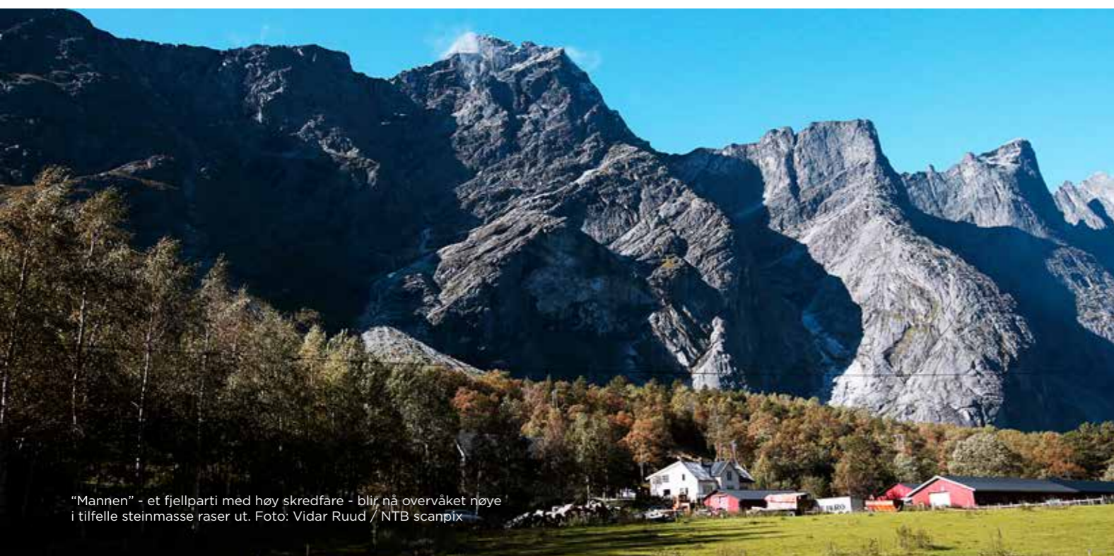
"Mannen" - et fjellparti med høy skredfare - blir nå overvåket nøye i tilfelle steinmasse raser ut.