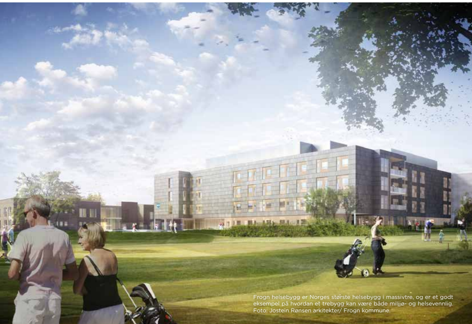
Frogn helsebygg er Norges største helsebygg i massivtre, og er et godt eksempel på hvordan et trebygg kan være både miljø- og helsevennlig. Foto: Jostein Rønsen arkitekter/ Frogn kommune.