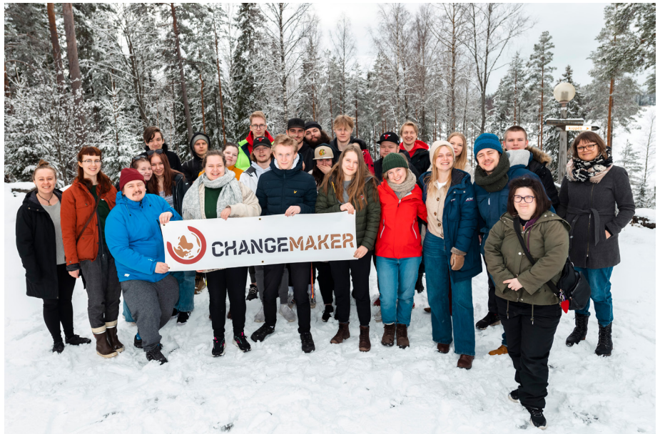
Kevään 2022 Changemaker-viikonloppussa oli ennätysmäärä osallistujia. Mukaan oli kutsuttu vapaaehtoisia myös Ruotsin ja Norjan sisarverkostoista.

Maailma kylässä -festivaaleilla toukokuun lopussa 2022 startattu Ei kestä! -kampanja vaatii päättäjiltä toimia, joilla ylikulutukseen