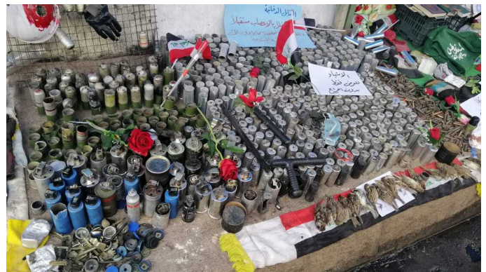
Mielenosoittajat ovat koonneet heitä kohti ammutuista kynnelkaasusäiliöistä muistomerkin.

Lokakuun vallankumouksen kaltaiset protestiliikkeet eivät ole uniikki ilmiö, vaan vastaavanlaista kansalaistoimintaa on syntynyt monessa maassa. Arabikeväästä on nyt yli 10 vuotta, ja mielenosoitukset jatkuvat yhä. Niiden lopputulokset ovat kuitenkin olleet vaihtelevia – usein seurauksena on ollut joko lyhytaikainen muutos, syvempi kaaos tai sisällissodan alkaminen. Vain Tunisiassa mielenosoitusten tavoitteita on saavutettu pidemmällä tähtäimellä. Monessa Lähi-idän maassa oikeusvaltion periaatteet eivät edelleenkaan toteudu, muutos näyttää hyvin hitaalta ja takapakkia tulee säännöllisesti. Taustalla on monia tekijöitä, jotka linkittyvät toisiinsa ja ovat tiiviisti juurtuneet maiden poliittiseen kulttuuriin. Arabikevään muisto kertoo toisaalta siitä, miten syviä monimutkaisia ongelmat ovat, mutta myös kansan pyrkimyksistä kohti parempaa huomista. 🌍