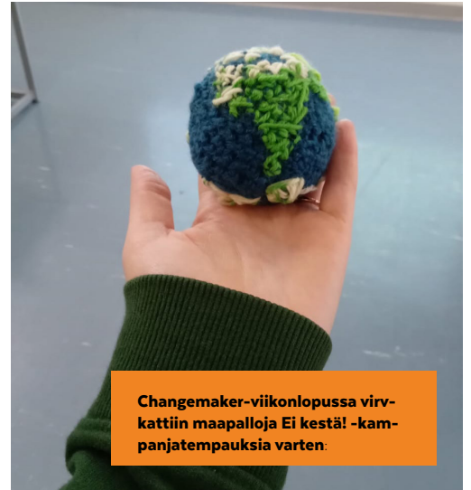
Changemaker-viikonlopussa virvattiin maapalloja Ei kestä! -kampanjatempauksia varten.