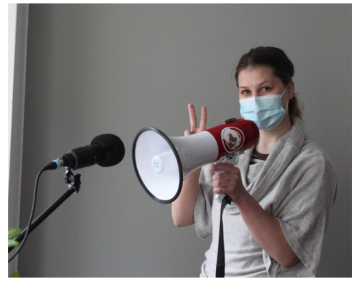
Changemaker oma Globalisti-podcast löytyy kaikista suosituimmista podcast-palveluista. Käy kuuntelemaan!