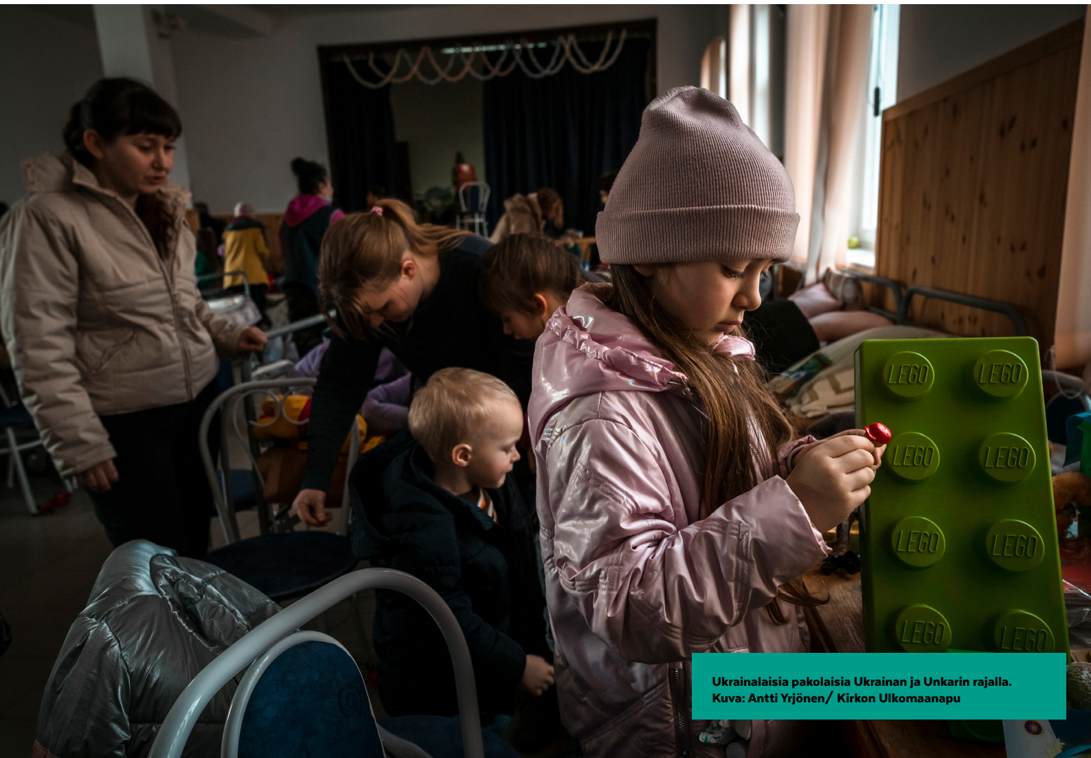
Ukrainalaisia pakolaisia Ukrainan ja Unkarin rajalla.

etnisen ryhmän jäsenten suunnitelmallista surmaamista tai mitä tahansa siviiliväestöön kohdistuvaa laajamittaista epäinhimillistä tekoa. 🌍