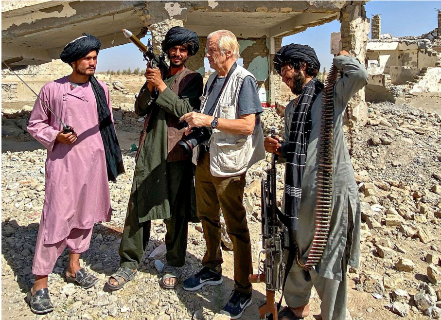
YLE-dokumentti, 2022, Ohjaus: Rauli Virtanen