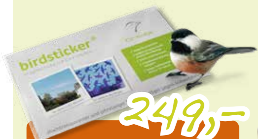
BIRDSTICKER 5 PK.

Du kan betale med v:pps i vår nettbutikk