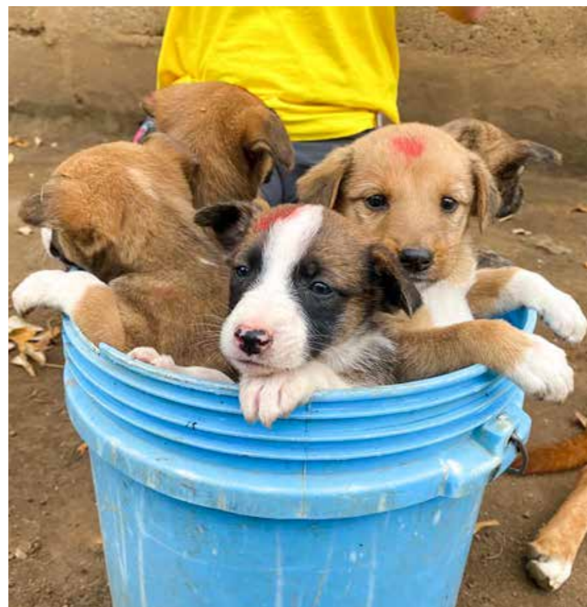
Vaksinerte valper ble merket i pannen.

Jeg kom hjem med vond rygg, men også glede for hvorfor jeg ble veterinær i utgangspunktet - for å forbedre dyrevelferden, hjelpe mennesker, og for å gjøre denne verden til et bedre sted for alle dens innbyggere. ■