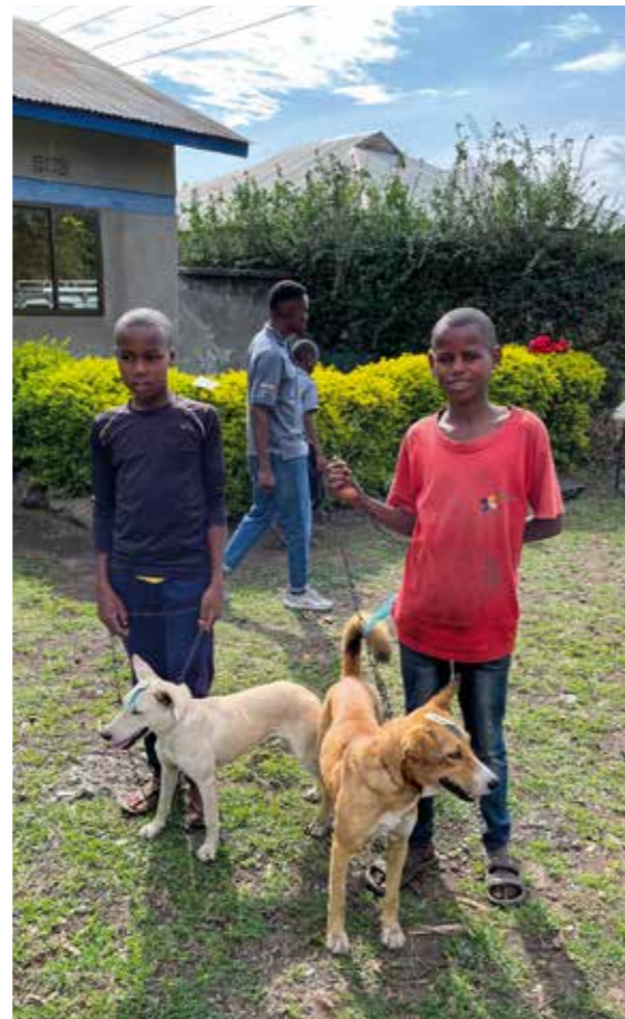
Barn og unge hentet hunder fra nabolaget slik at disse kunne bli vaksinert.

Jo flere valper som fødes, jo lavere blir andelen vaksinerte dyr og med dette synker flokkimmunitetsnivået.