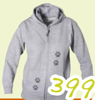
HETTEGENSER BARN «DYREDEKTIVENE»

Denne passer perfekt til store og små, og kommer med bærestropper som gjør den behagelig å bære. Bagen er laget av økologisk bomull. Gymbagen er 39x46 cm. stor.