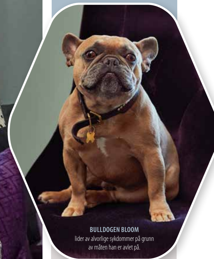
BULLDOGEN BLOOM lider av alvorlige sykdommer på grunn av måten han er avlet på.

Støtt kampen mot uetisk hundeavl via Dyrebeskyttelsen Norge sin Vipps 2271 (#sunnhund)