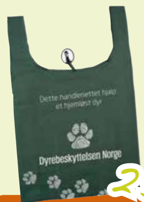
HANDLENETT 5 PK.

Handlenettet er svært romslig og kommer i en pakke å 5 stykker (bredde: 40 cm. x høyde: 69 cm. x 15cm.). Da har du nok handlenett til ukeshandelen – eller du kan gi bort ett til en venn. Handlenettet kan enkelt legges sammen med strikken som medfølger og tar liten plass i veske/lomme. Den har også en krok, slik at du kan henge den på sekk/veske.