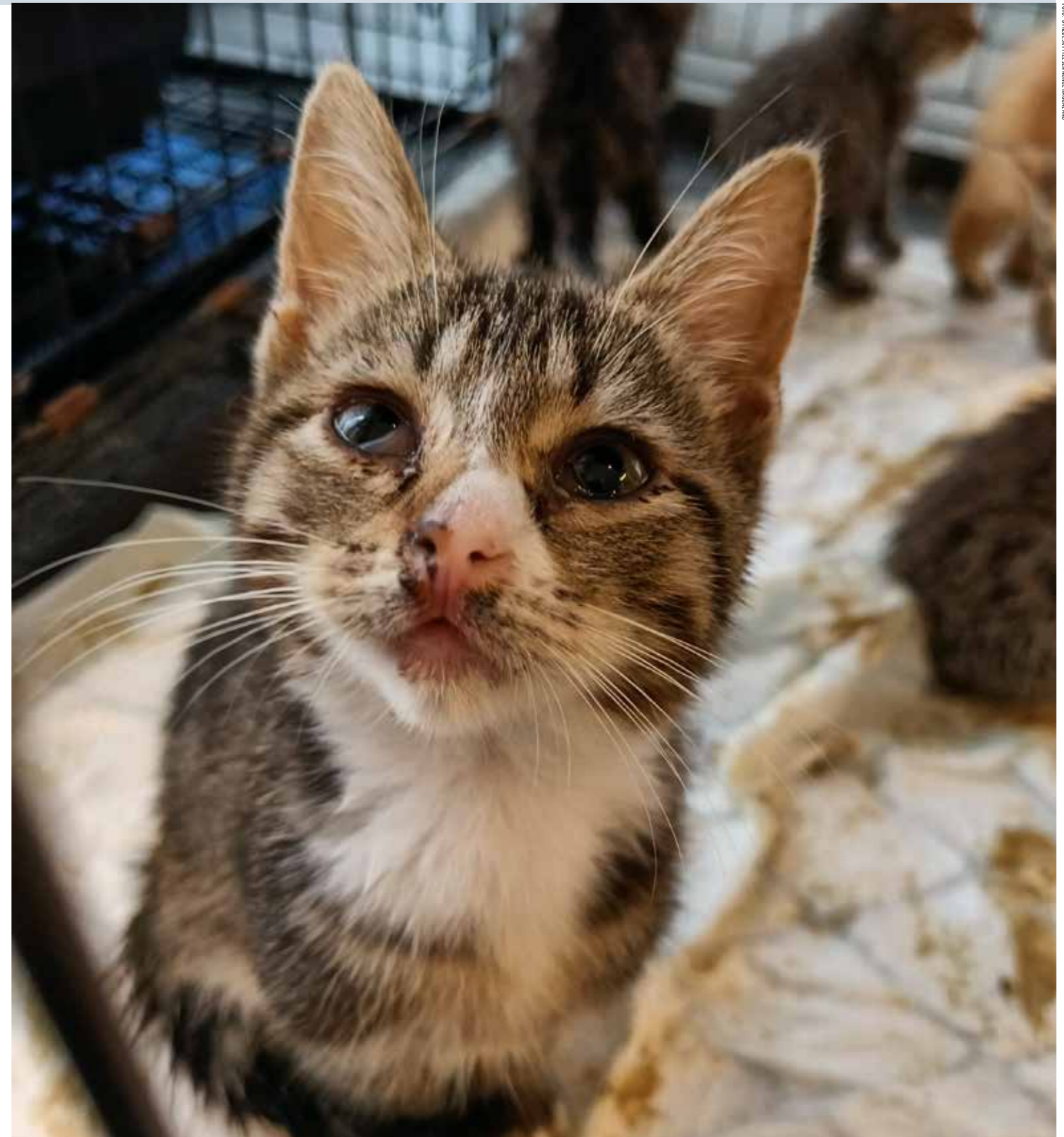
DENNE KATTUNGEN var del av en større ansamling katter som lokalavdelingen vår i Haugaland måtte redde ut fra en bolig.

Mattilsynet må ta i bruk dyrevernemdene og bruk de ressursene som allerede er tilgjengelige. ■