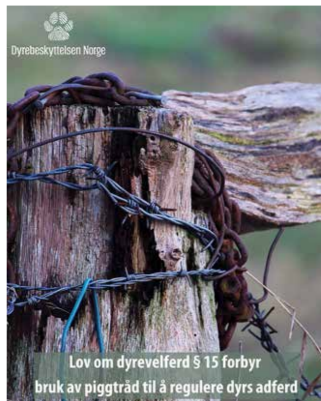
Dyrebeskyttelsen Norge håper flere kommuner iverksetter prosjekter for å rydde gammel piggråd.

Oppføring av piggråd har vært forbudt siden 2010, men fortsatt er det mye piggråd som ligger slengt rundt om i norsk natur og utsetter dyr for fare. Dyrebeskyttelsen Norge oppfordrer flere kom- muner til å inngå slike samarbeidsprosjekter som i Rogaland.