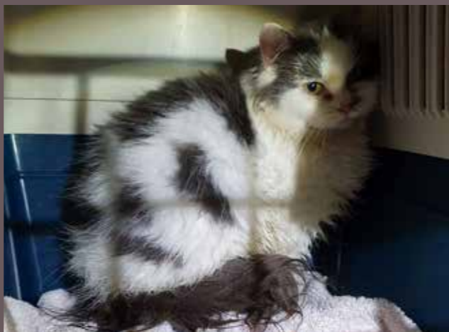
KATTEN Tove-Michelle ble reddet inn av vår lokalavdeling i Tromsø. Bildet er tatt ved inntak.

at organisasjonen i 2012 tok in 4021 hjemløse dyr og brukte 9,7 millioner kroner på dette arbeidet. Rapporten fastslo at dette var en økning fra tidligere.