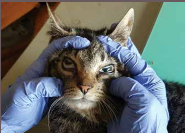
VÅR LOKALAVDELING i Bodø har jobbet med en katterkoloni på Røst over lengre tid. Kattene i kolonien er svært preget av sykdom, skader og underernæring.