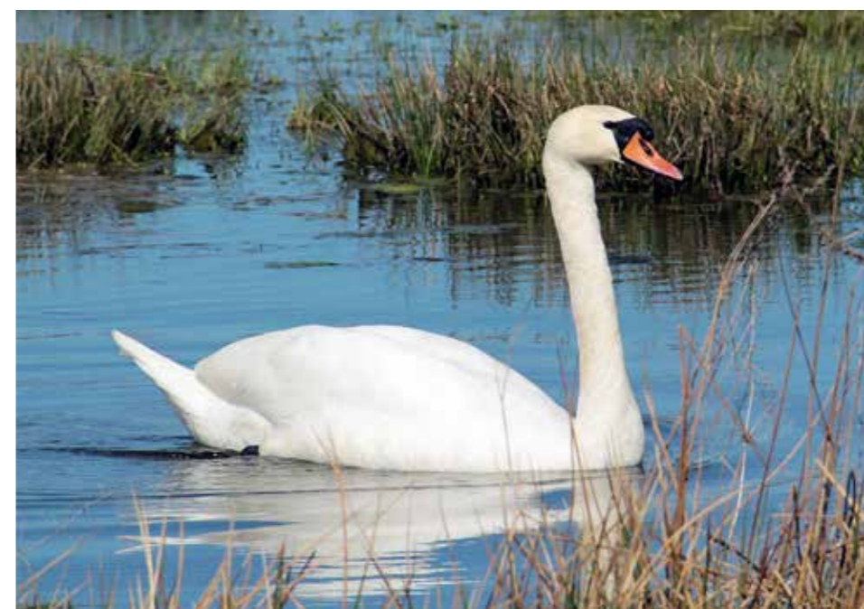
Flere svaner har blitt utsatt for grov vold denne sommeren.

Dette er en av mange saker denne sommeren om svaner som blir mishandlet.