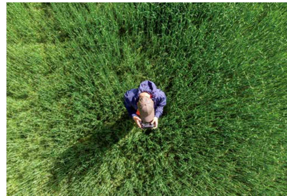
En droneoperatør med termisk kamera kan finne rådyrkje som gjemmer seg ute i gresset.

Dyrebeskyttelsen Norge synes det er svært positivt at bransjen finner løsninger for å forhindre at rådyrene blir drept under slått, og oppfordrer flere bønder til å benytte seg av slike løsninger som dette. Det anslås at 4000 rådyrkalver dør som følge av slåmaskiner hvert år. Dette er både en tragedie for rådyrene og for bøndene som opplever dette og får foret som skal brukes til å mate husdyrene sine ødelagt.