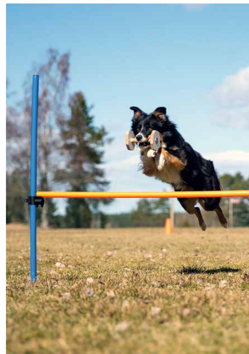
DIVA trives med fart og spenning.

Diva er en border collie på to år som jeg importerte fra Italia. Onkelen hennes er faktisk to ganger verdensmester i konkurransedygighet, og jeg har et mål om at Diva og jeg også skal konkurrere i VM en dag. Hun er en veldig selvstendig type og vil helst bare løpe hele tiden, men hun ser ut til å kunne bli en fin lydighetshund. Hennes favorittaktivitet er nok svømming, det kan hun gjøre i evigheter uten å se ut til å bli sliten i det hele tatt.