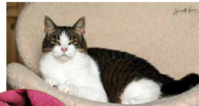
ULRIK ÅGE er en av mange katter som har fått et bedre liv.