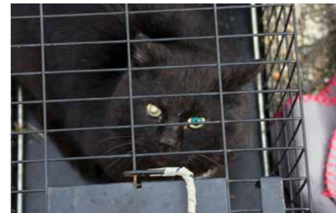
EN AV MANGE katter lokalavdelingen har reddet ut fra en koloni på Verøy.