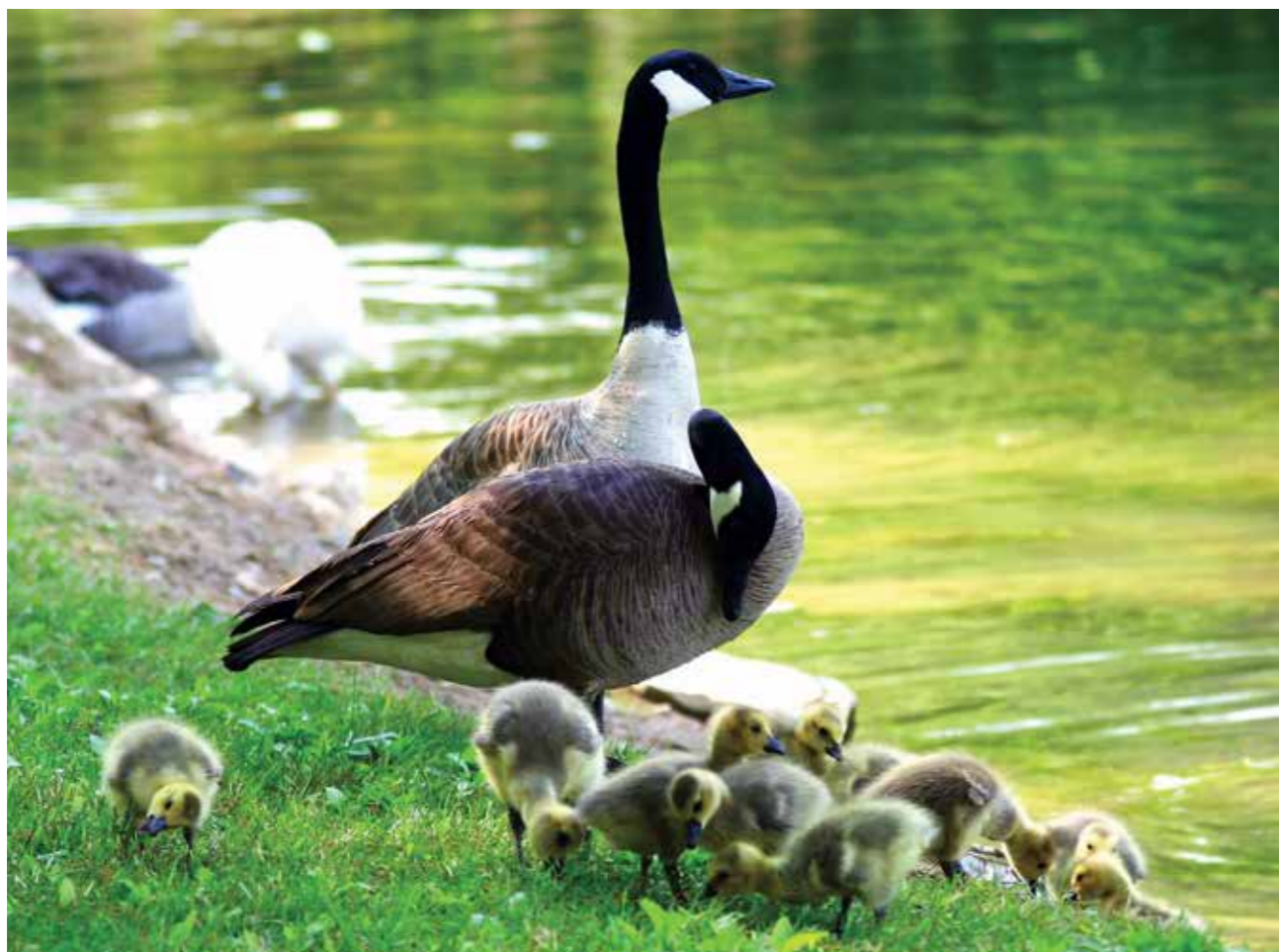
Kanadagjess med unger.