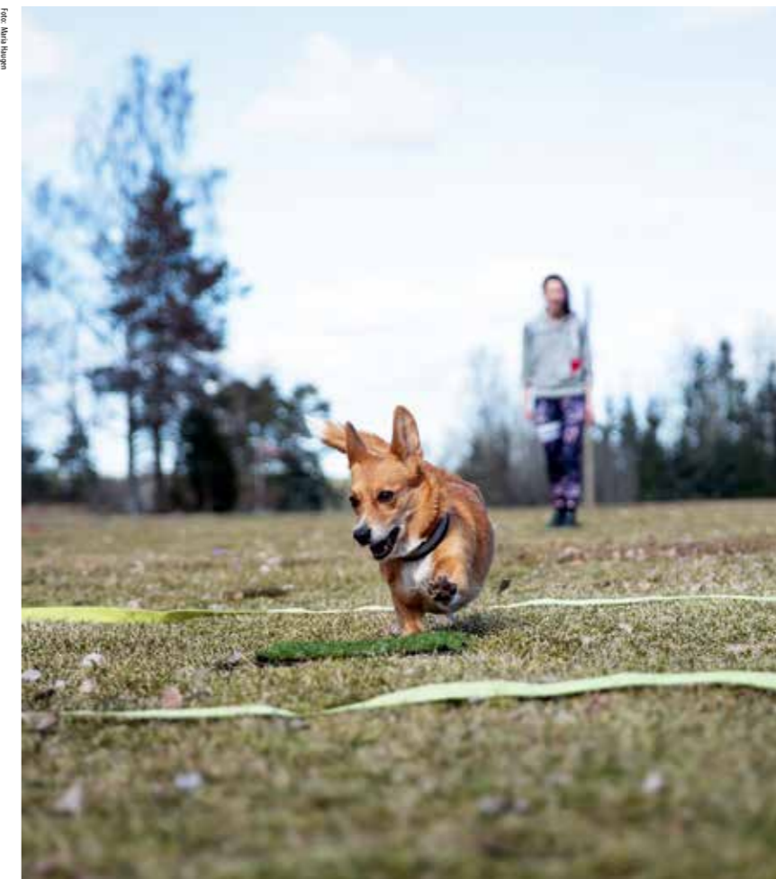
AYA synes det er moro å trene.

Hundene mine bruker jeg først og fremst til konkurranselydighet. Da lærer vi inn spesi- fikke øvelser som er i et lydighetsprogram, og vi konkurrerer for å få karakterer og tilbakemeldinger på hvordan vi ligger an. Jeg satser seriøst med mine hunder, og målet er å gå VM og Nordisk mesterskap for Norge. I tillegg til lydighet, driver vi med gjeting av sau. Det gjør vi først og fremst for å få litt avveksling fra lydigheten, men det er virkelig noe helt spesielt med å se en hund jobbe med det den er laget for å jobbe med. Jeg har ikke egen sau, men er så heldig å få trene på sauene på en gård i nærheten av der jeg bor. Hvis vi legger sammen både lydighetstrening og gjeting, trener vi normalt tre til fem dager i løpet av en uke.