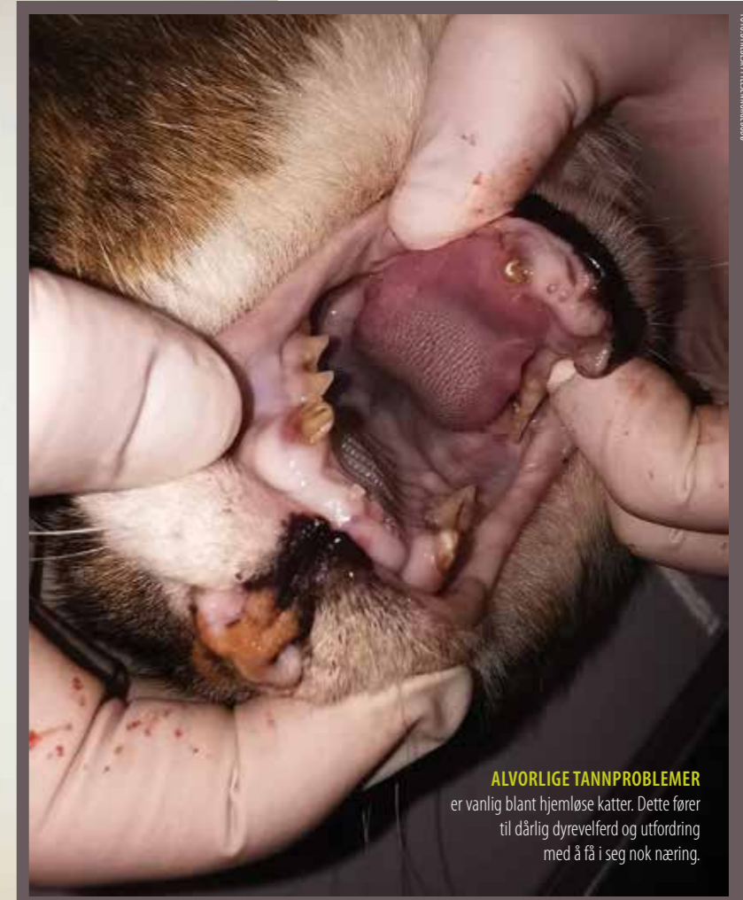
ALVORLIGE TANNPROBLEMER er vanlig blant hjemløse katter. Dette fører til dårlig dyrevelferd og utfordring med å få i seg nok næring.

Tolv år etter rapporten til arbeidsgruppen oppnevnt av Statens dyrehelsetilsyn kom ut, produserte Dyrebeskyttelsen Norge en egen rapport om hjemløse dyr i 2013. Rapporten presenterte status for det frivillige arbeidet med hjemløse dyr i Norge. Rapporten viste