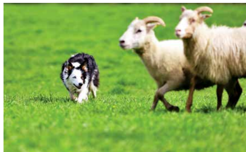
WHITNEY er en god gjeterhund.

Felles for alle disse hundesportene er at det krever et godt samarbeid mellom hund og menneske, og det skal i tillegg være gøy for begge to.