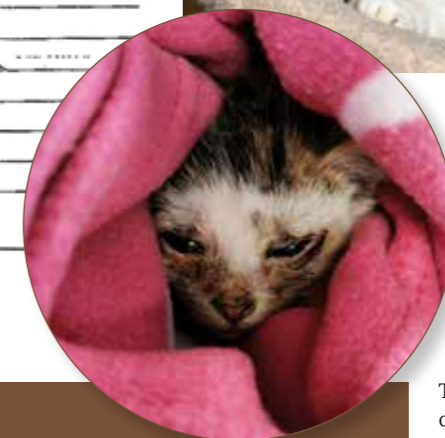
KATTUNGENE fra en koloni på Røst var svært medtatte da de ble reddet.

og slå av en prat med kjentfolk. Vi er ekstremt stolte av at vi klarer å gjennomføre et slik arrangement, og er ekstremt slitne to helger i året. Korona har imidlertid medført en ufrivillig (men litt velfortjent) pause. I 2019 hadde vi to loppemarked, brukte cirka 1600 dugnadstimer og beløpet ble seksssifret.