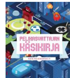
Pelikasvattajan käsikirja pelikasvatus.fi/kasikirja

Hinta: 200 € / päivä / kouluttaja (max. 5 oppituntia) tai 300 € / päivä / kouluttaja (max. 5 oppituntia ja vanhempainilta). Hinnat sisältävät matkakulut ja vanhempainillan materiaalit.