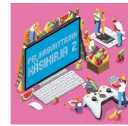
Pelikasvattajan käsikirja 2 pelikasvatus.fi/kasikirja2