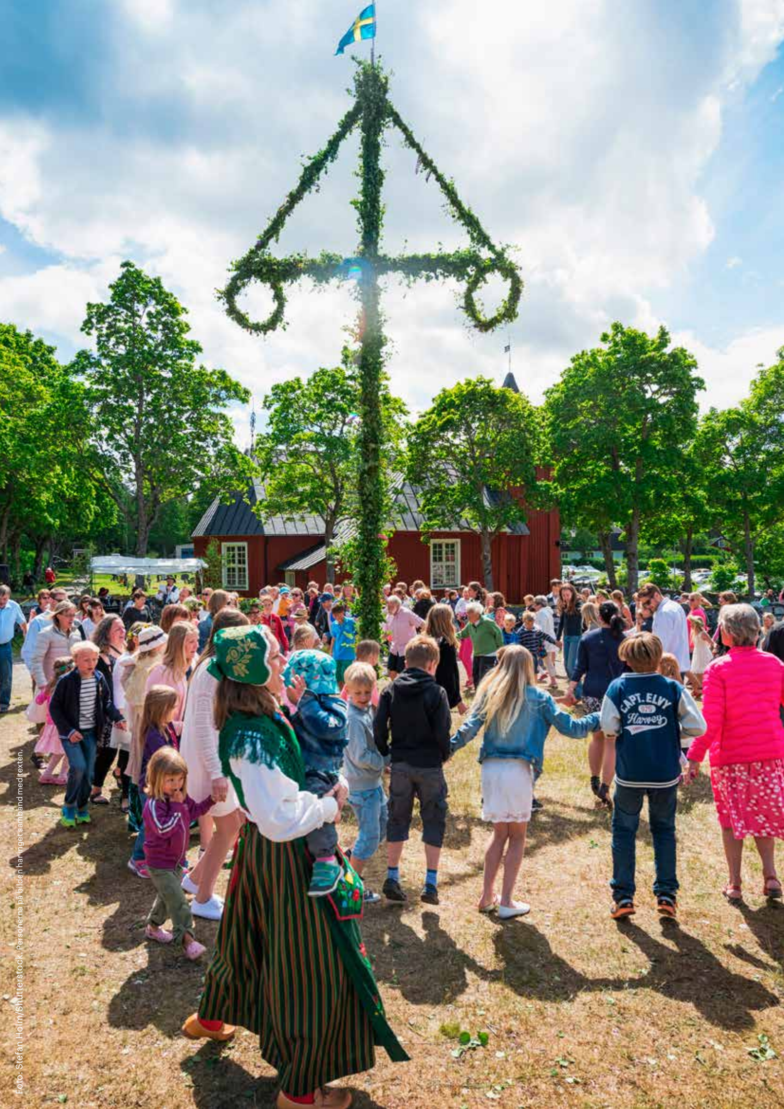
Personerna på bilden har inget samband med texten.