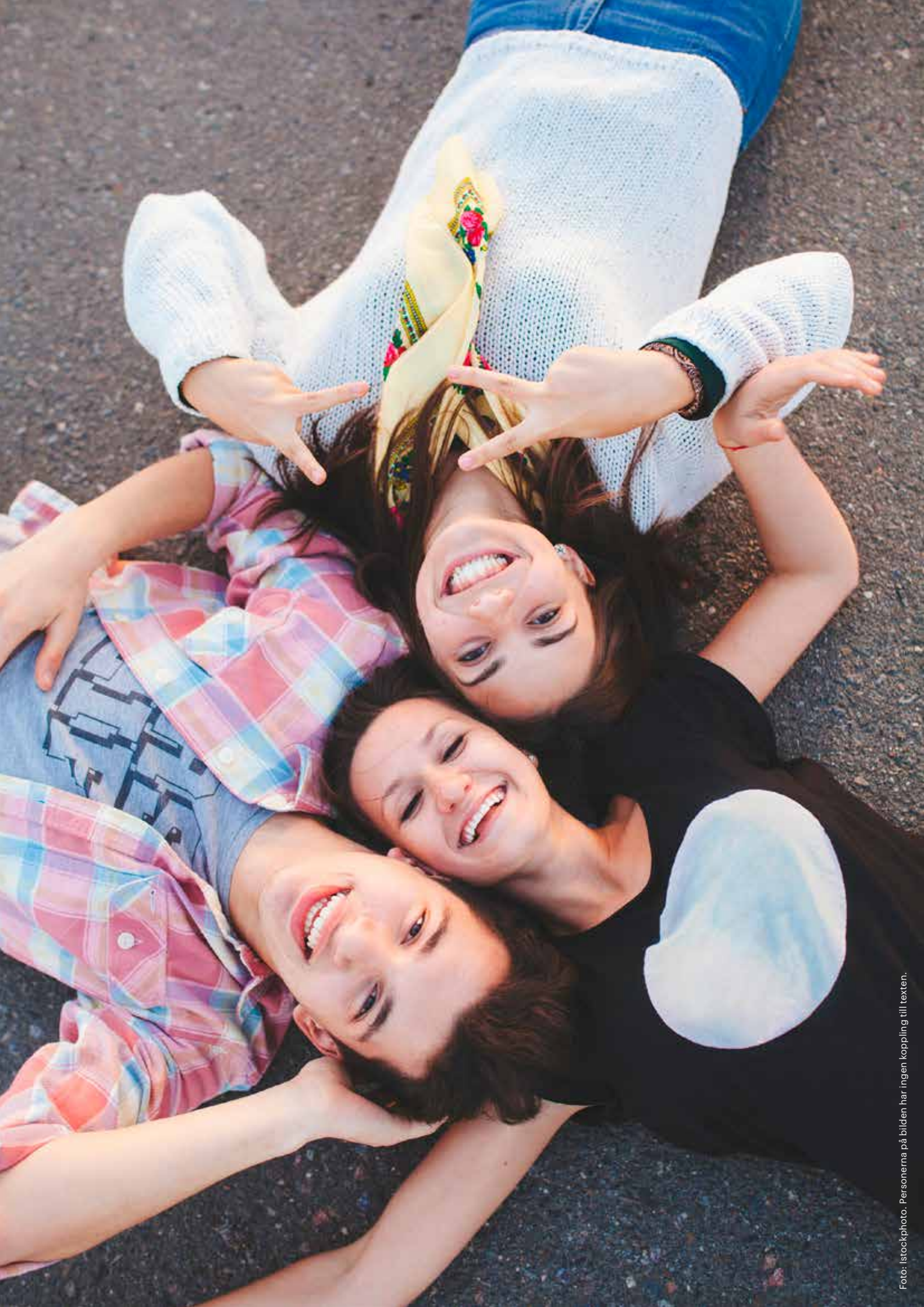
Personerna på bilden har ingen koppling till texten.