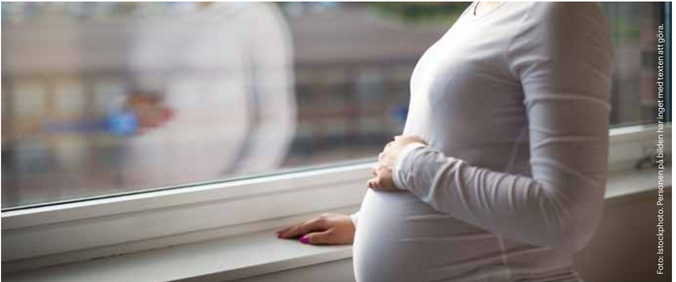
Foto: istockphoto. Personen på bilden har inget med texten att göra.