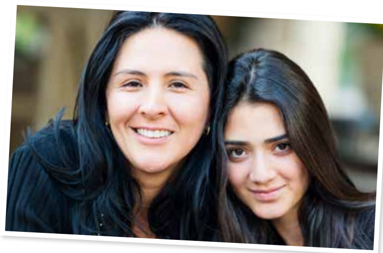
Foto: Istockphoto. Personerna på bilden är inte de som nämns i texten.

Berusad Person som druckit mycket alkohol.