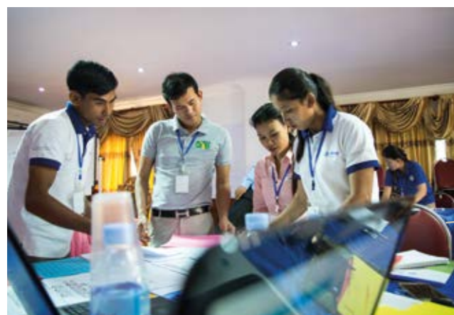
Tutkimusten mukaan jokainen riskinhallintaan käytetty euro säästää noin viisi euroa hätävasta katastrofin jälkeen.

Teksti: Erik Nyström