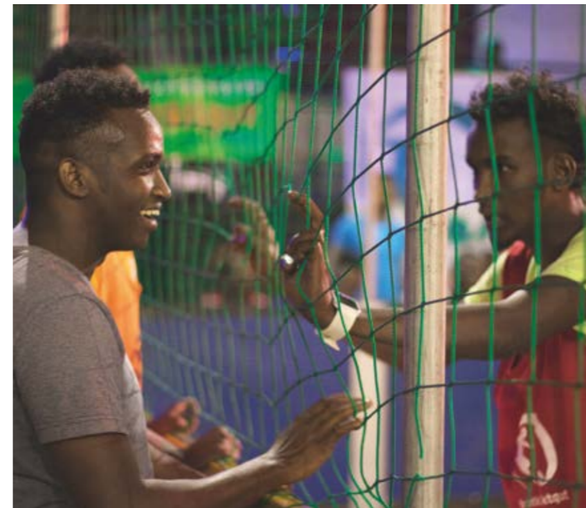
Jalkapallo toimii sillanrakentajana, koska kaikki tuntevat lajin ja säännöt ovat kaikkialla samat.

vapaikkapäätöstä jo runsaan vuoden ja haaveilee parturin ammatista.