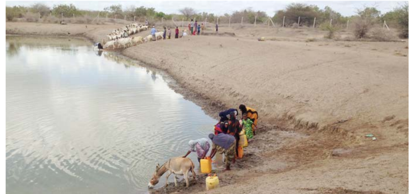
Eläimet ja ihmiset keräntyivät saman niukan vedenlähteen äärelle Pohjois-Keniassa maaliskuun lopulla.