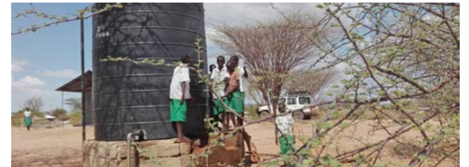
Ulkomaanapu toimittaa vettä 42 koululle kuivuudesta kärsivässä Pohjois-Keniassa, jotta lasten ei tarvitsisi jättää koulunkäyntiä kesken.

LYHYET SADEKUURROT EIVÄT AUTA Somalian Baidoassa vettä on kuljettu Ulkomaanavun tuella neljään kylään. Baidoassa saatiin vesikuuro huhtikuun lopulla, mutta kuurot aut-