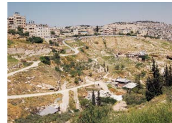
Rabbis for Human Rights -järjestö vie israelilaisnuoria tutustumaan palestiinalaisten oloihin muun muassa Itä-Jerusalemossa.

pakolaislasta on päässyt oppimaan Ulkomaanavun koulutuskeskuksissa Kreikassa kesän 2016 jälkeen. Ulkomaanapu ja Unicef pyrkivät tarjoamaan koulunkäyntiin valmistavaa opetusta ja harrastusmahdollisuuksia vähintään 15 prosentille Kreikassa olevista pakolaislapsista.