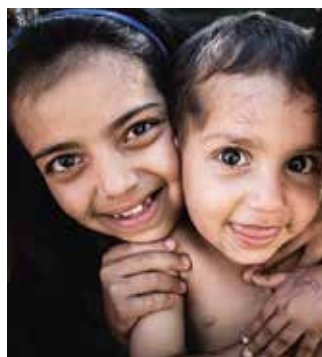
Afghanska barn på flykt i Grekland 2015.

VÅLD. Minst 16 anställda döddes den 6 mars när självmordsbombare gick till attack mot ett företag i staden Jalalabad i östra Afghanistan. Ingen grupp har tagit på sig attacken.