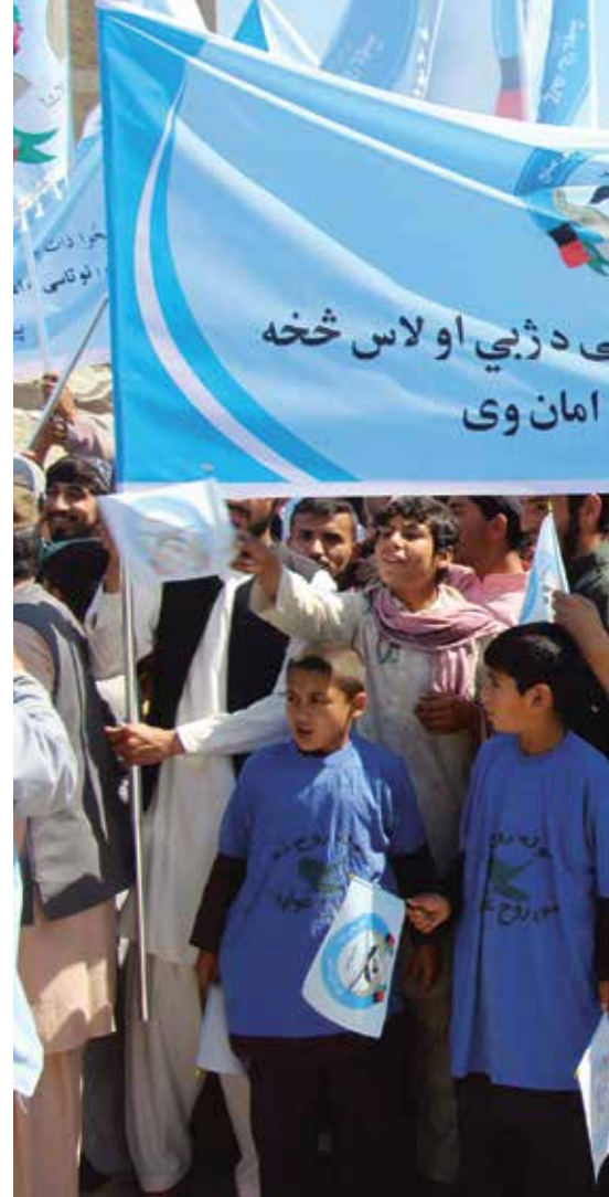
Demonstranter i Kandahar kräver att regeringen arbetar