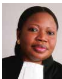
Fatou Bensouda, chefsåklagare ICC.

– Domarnas logik tillåter effektivt stater att välja bort sin skyldighet att samarbeta i ICC:s undersökning. Detta sänder ett farligt budskap till förövare som kan ställa sig utanför lagens räckvidd bara genom