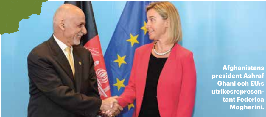
Afghanistans president Ashraf Ghani och EU:s utrikesrepresentant Federica Mogherini.