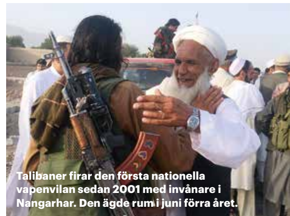
Talibaner firar den första nationella vapenvilan sedan 2001 med invånare i Nangarhar. Den ägde rum i juni förra året.