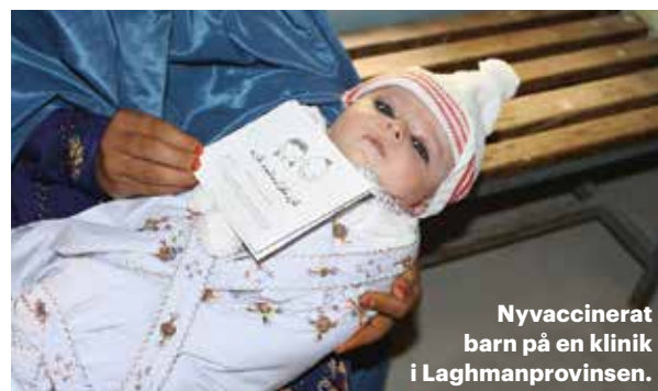
Nyvaccinerat barn på en klinik i Laghmanprovinsen.

patientbesök gjordes på SAKs kliniker under 2018. 58 PROCENT var kvinnor.