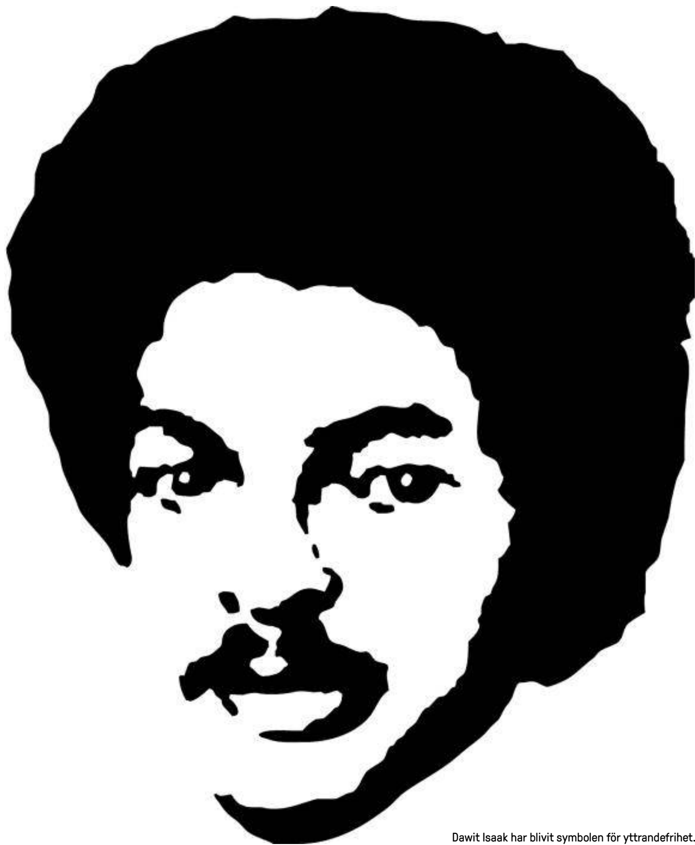
Dawit Isaak har blivit symbolen för yttrandefrihet.